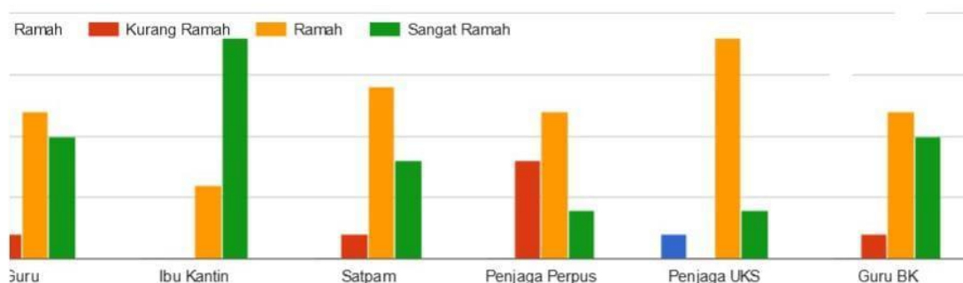
Gambar 1. Grafik kuesioner data sumber daya manusia SMAN 1 TAMAN

Bagaimana kualitas Sumber Daya Manusia di lingkungan Anda